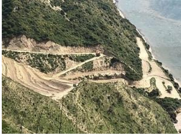
Φωτ. 4 & 5: Συνέχεια παράνομων εργασιών εντός της ζώνης Φ1 (Μάρτιος, Απρίλιος 2018).