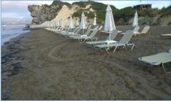
Φωτ. 8: Μη απομάκρυνση επίπλων θαλάσσης κατά τις βραδινές ώρες (2017).