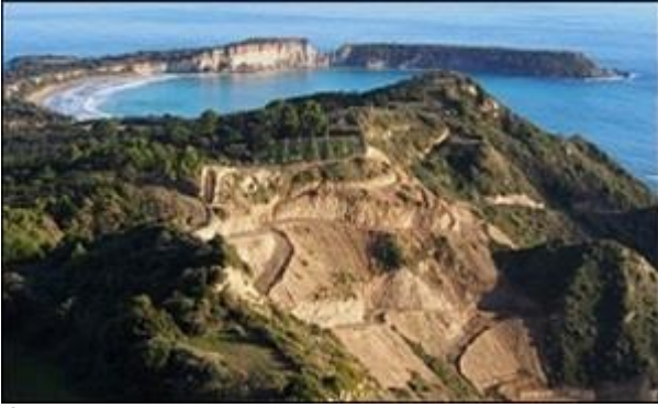
Φωτ. 3: Παρέμβαση εντός της Περιοχής Προστατευόμενου Τοπίου (Φ1) το έτος 2015.