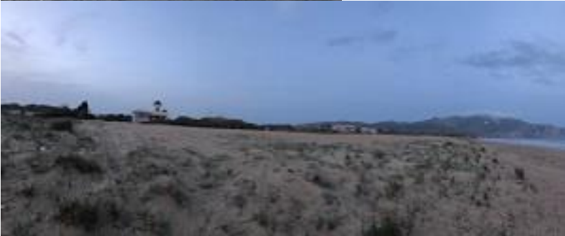
Φωτ. 6 & 7: Αποψίλωση θινών εντός της Περιοχής Προστασίας της Φύσης (Π3).