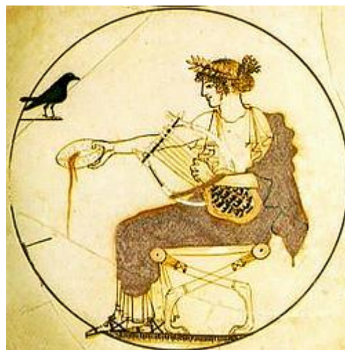
Ο Απόλλωνας, θεός του ήλιου