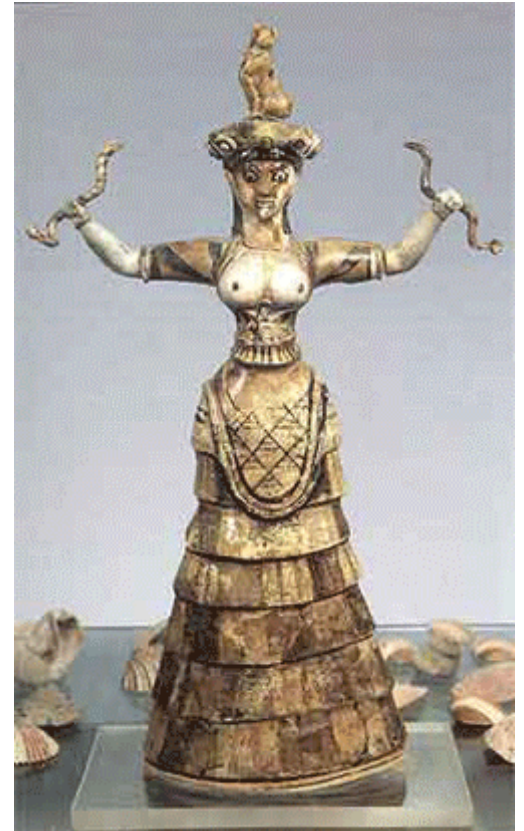
Η Μινωική Μεγάλη Θεά, η Πότνια Θηρών