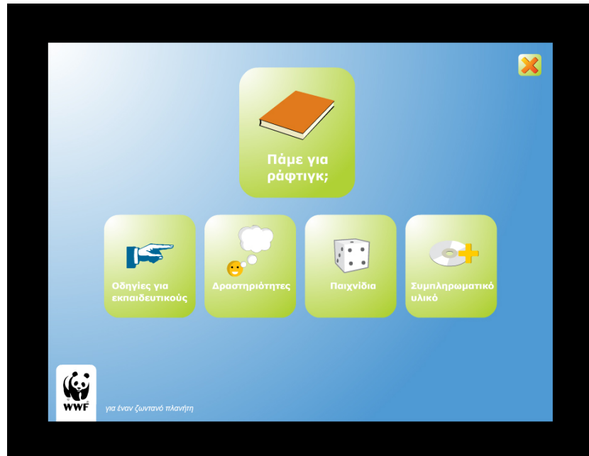
Εικόνα 1. Το βασικό μενού του CD rom «Το Κλίμα είναι στο Χέρι σου». Εύληπτη δομή του υλικού και φιλικότητα προς τον χρήστη.

και βίντεο. Στο «Συμπληρωματικό υλικό» περιλαμβάνονται (α) corpus δημοσιευμάτων για την κλιματική αλλαγή, (β) βιβλιογραφία, χρήσιμες διευθύνσεις στο Διαδίκτυο και σύντομη περιγραφή του περιεχομένου τους καθώς και στατιστικά στοιχεία, (γ) γλωσσάρι με πλήρη κατάλογο των επιστημονικών όρων που σχετίζονται με την κλιματική αλλαγή και επεξήγησή τους με όσο το δυνατό απλούστερη γλώσσα.